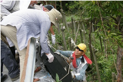
不法投棄ゴミを回収