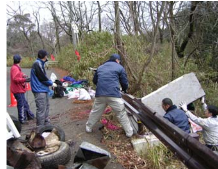
力を合わせて大型ゴミの引き上げ