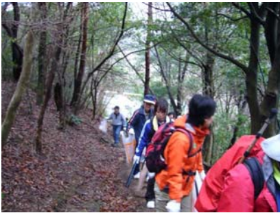
クリーンハイキングの様子

箕面の山のハイキングコースを、毎月パトロール隊員と一般参加者が一緒になってクリーンハイキングを行っています。各コースとも四季折々の見所や歴史的な見所が満載です。