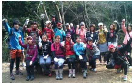
「クリーン」トレランもやっています