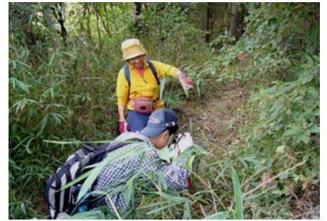
コースの植生調査・観察