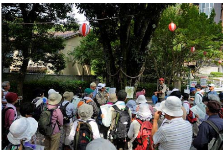
マップを使った巨樹をめぐるハイキング