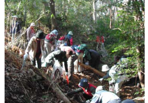
ごみの斜面へいざ回収へ