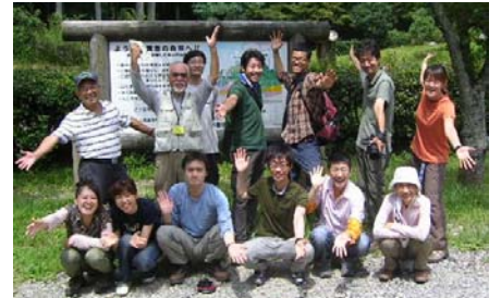
クリーンハイキングですっきり！