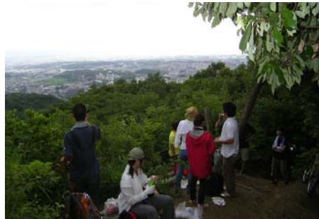
眺めのよいポイントで休憩中