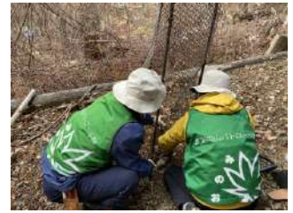
△こもれびの森で植樹