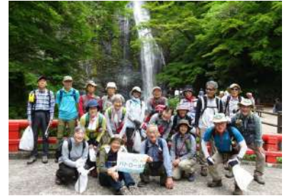
△クリーンハイキング（5月・天上ヶ岳）