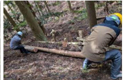
△丸太を使ってハイキング道を整備