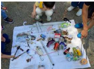
△集めたゴミを確認します