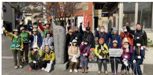
△森の学校でクリーンハイキング体験