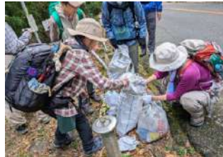
△勝尾寺コースでの回収ゴミ