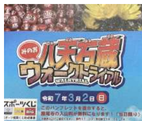
△八天石蔵ウォークトライアル