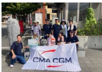
△動物調査&クリーンハイキングには企業参加も多くいただきました。