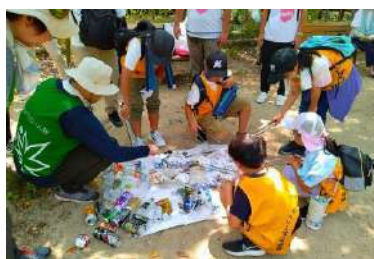
△阪急阪神ゆめ・まちチャレンジ隊