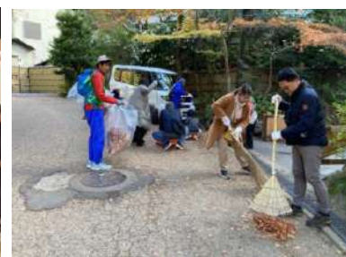
△滝道の落ち葉清掃(5・12月)