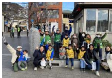
△駅前からゴミ拾いをスタート