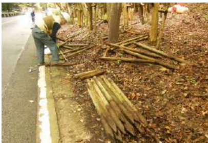
△茶長坂の支柱を再利用