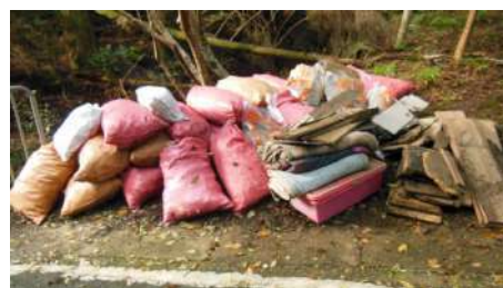
△配線カバーの大量不法投棄ゴミ