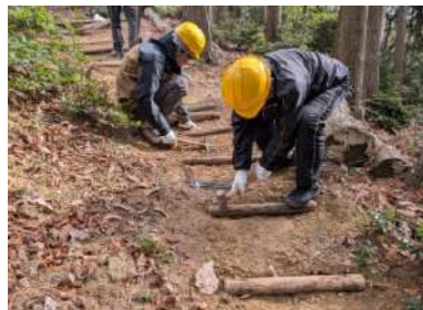
△こもれびの森の階段づくり