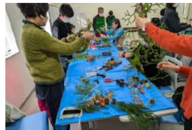
△自然の材料を使ってリースづくり