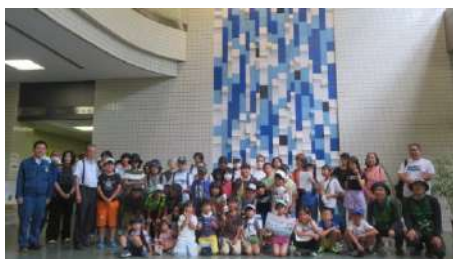
△環境クリーンセンターに行こう！