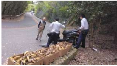
△府道沿いにバイクとバナナの投棄