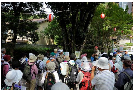
マップを使った巨樹をめぐるハイキング