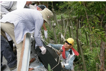
不法投棄ゴミを回収