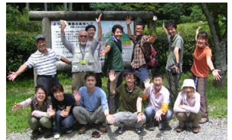
クリーンハイキングですっきり！