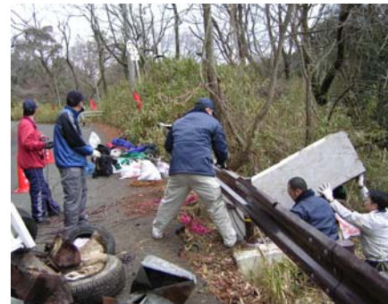
力を合わせて大型ゴミの引き上げ