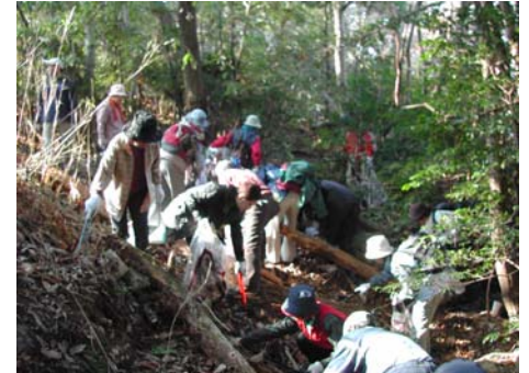
ごみの斜面へいざ回収へ